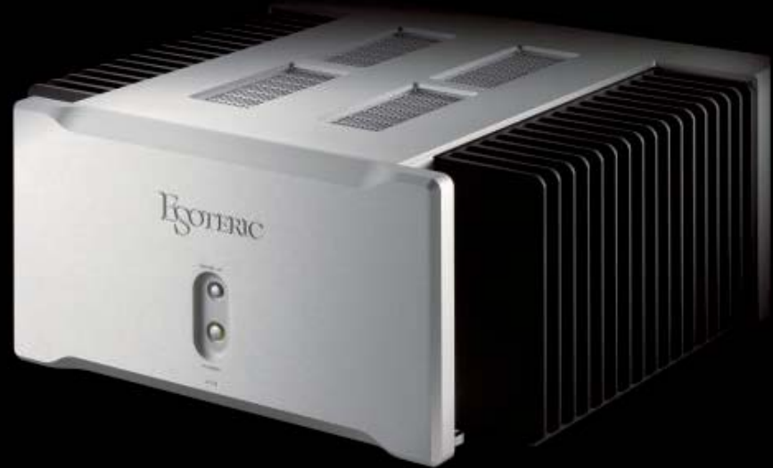
STEREO POWER AMPLIFIER A-03 希望小売価格945,000円(税抜900,000円)