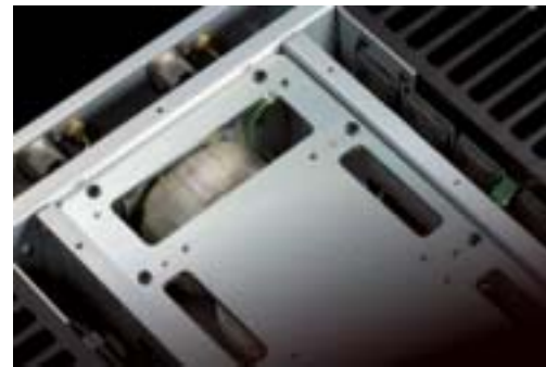
L/R独立トイダルトランスと電圧増幅段専用トイダルトランス

電流増幅段をドライブする電圧増幅段にも、独立したトランスと電源回路を設けることにより、電力変動の影響を抑えて安定した電力を供給。回路ブロックごとに電源回路を分離し、さらにトランスまで独立搭載することで、音楽の強靭さと繊細な表現の両立を可能にしています。