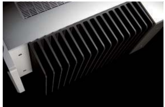
ブラックアルマイト処理の大型ヒートシンク

通常の動作時より消費電力を抑えつつ、音楽再生に備えて、機器をウォーミングアップすることが可能です。(ウォームアップ時:約45%減、消費電力:220W)