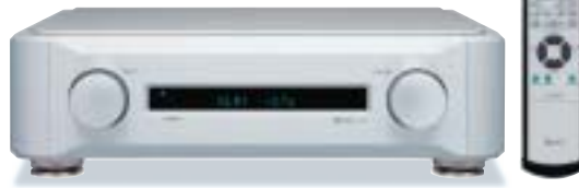
ステレオプリアンプ C-03 希望小売価格840,000円(税抜800,000円)リモコン付属