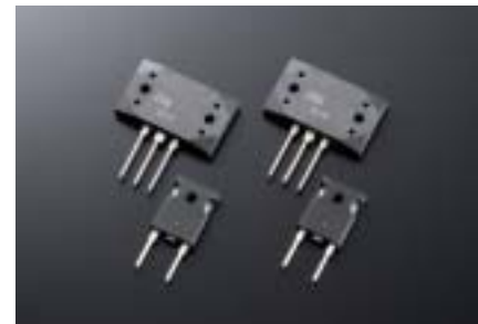
電流増幅段の出力段用大型トランジスター(上) 電流増幅段用ショットキーバリアダイオード(下)

さらに高周波低インピーダンスタイプの電解コンデンサ、トランジスターなど、特性と試験の両面から追い込んだ高品位パーツを随所に投入しています。