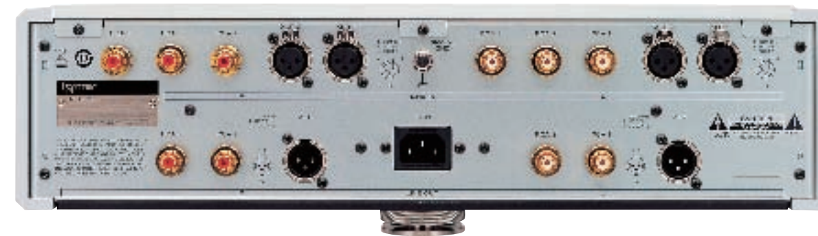
Stereo Preamplifier C-03 Specifications