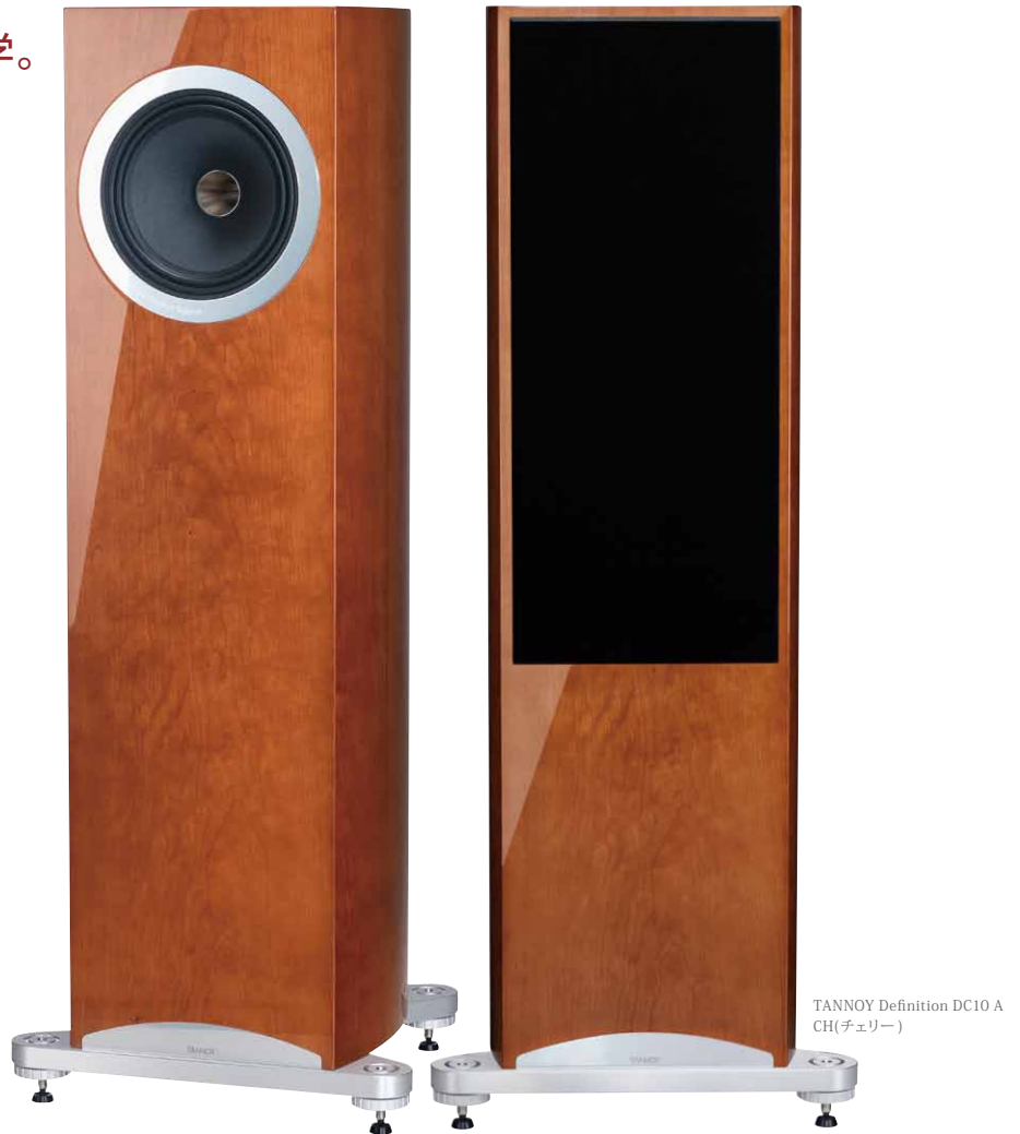
TANNOY Definition DC10 A CH(チェリー)

1926年創業の永い歴史を誇る生粋の英国ブランド、タンノイ。その伝統を軸とする卓越した音響エンジニアリング、デザイン・フィロソフィーを凝縮して誕生したモダンスピーカーがDefinition (ディフィニション) シリーズです。シリーズの頂点に君臨するフラッグシップモデル、DC10Aは、大型アルニコマグネット『ALCOMAX-III』と本格的なコンプレッションツイーターを搭載した新設計10インチ・デュアルコンセントリック(同軸2ウェイ)ドライバーを搭載。